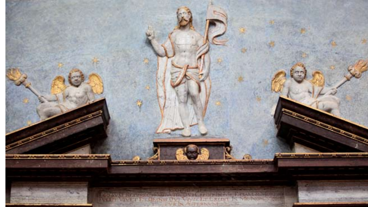
Kristus a dva nosiči pochodní v katedrále svatého Víta vyjadřují stejnou symboliku jako Kautes a Kauto-pates v kultu Mithry. První symbolizuje východ slunce a zároveň jaro, druhý slunce zapadající a zimu.

Symbolika boha Mithry obětujícího býka byla převzata i do křesťanské ikonografie. Stejný charakter má archanděl Michael, zpodobňovaný, jak zabíjí Satana či draka Apokalypsy. Mithraický motiv je obzvláště patrný při znázorňování patrona zemědělců a rytířů svatého Jiří. Jeho zápas