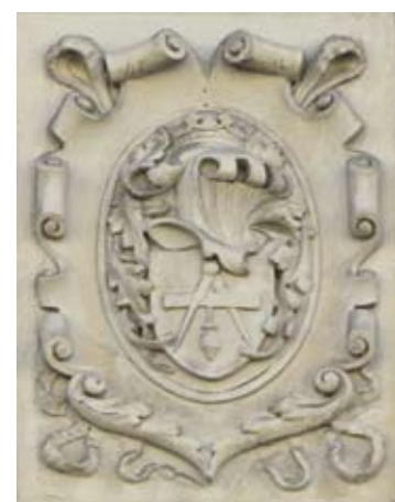
◀ Krokvice s kružítkem na domě v ulici Dukelských hrdinů.

Krokvice, úhelník nebo pravítko s olovnicí (vodováha), symbolizuje soulad, rovnováhu a rovnost. Olovnice (závaží), která ukazuje přímý svislý směr, představuje hloubku pozorování a úsudku, spravedlnost, pravdomluvnost, upřímnost a čestnost promítnutou do činů.