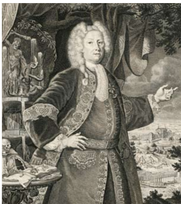
Hrabě František Antonín Špork.

Svatý Jan Křtitel zvaný Předchůdce je zároveň posledním prorokem a prvním křesťanským svatým mučedníkem. Mezi mnohé profese, jejichž je patronem, patří i členové původního jednotného stavitelského cechu, tedy kameníci, zedníci a tesáři, architekti, stavitelé, ale i ti, kteří převzali jejich symboliku a rituály, svobodní zednáři.