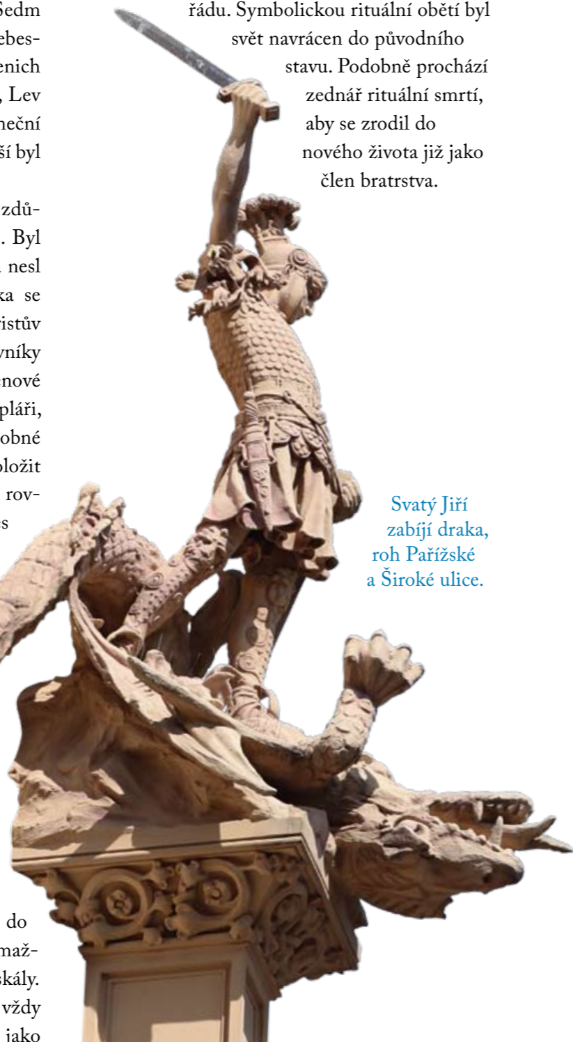
Svatý Jiří zabíjí draka, roh Pařížské a Široké ulice.

Motiv zabíjení býka znamenal obnovu řádu. Symbolickou rituální obětí byl svět navrácen do původního stavu. Podobně prochází zednář rituální smrtí, aby se zrodil do nového života již jako člen bratrstva.