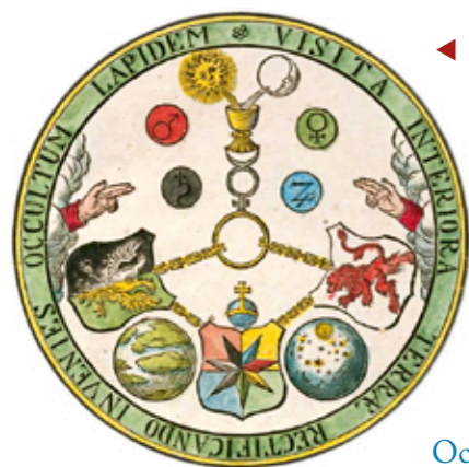
Diagram (z knihy Tajné symboly rosikrucianů, 1786) symbolicky vysvětluje Smaragdovou desku. Nápis je vysvětlením latinské zkratky V.I.T.R.I.O.L., navštív nitro země, očistěním najdeš skrytý kámen (Visita Interiora Terrae Rectificando Invenies Occultum Lapidem).

Hrůzostrašný Kerberos stráží vchod do podsvětí a hlídá říši mrtvých nazvanou podle jejího vládce Hádés. Trojhlavý pes s dračím ohonem symbolizuje „strážce prahu poznání“ i přirozený strach z neznámého. Poznáváním skrytých tajemství a snahou pochopit neznámé obohacujeme své nitro a unikáme před otupujícím stereotypem neustále opakovaných návyků. Kerberos připomíná, že hlubší poznání vyžaduje odhodlání a odvahu.