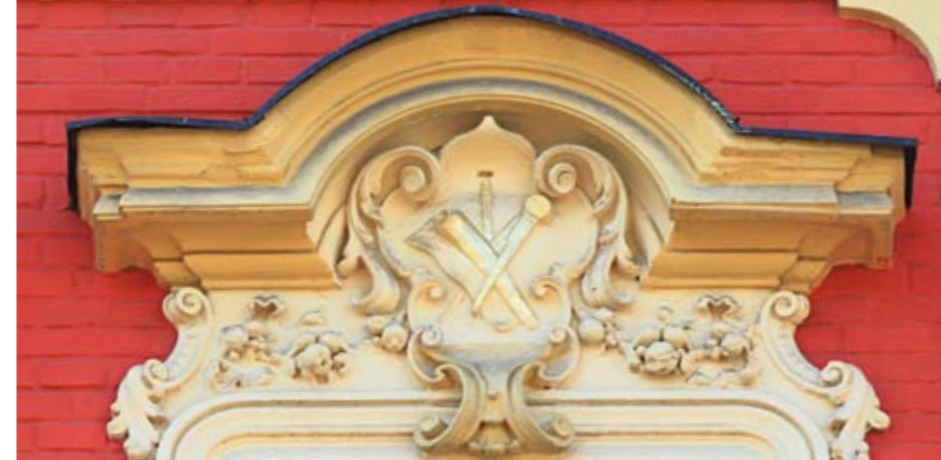
◀ Kružítko a svítek na domě v Otakarově ulici.

Kružítko představuje čin stvoření a tvarem připomíná písmeno A (alfa), počátek všeho. Značí dovednost, poznání a zdrženlivost. Vytyčuje hranice, za které je vykázáno všechno škodlivé a špatné, zatímco pevná víra a oddanost jsou uchovány uvnitř ochranného kruhu. Kružnice znázorňuje proces, nemá konec ani začátek.