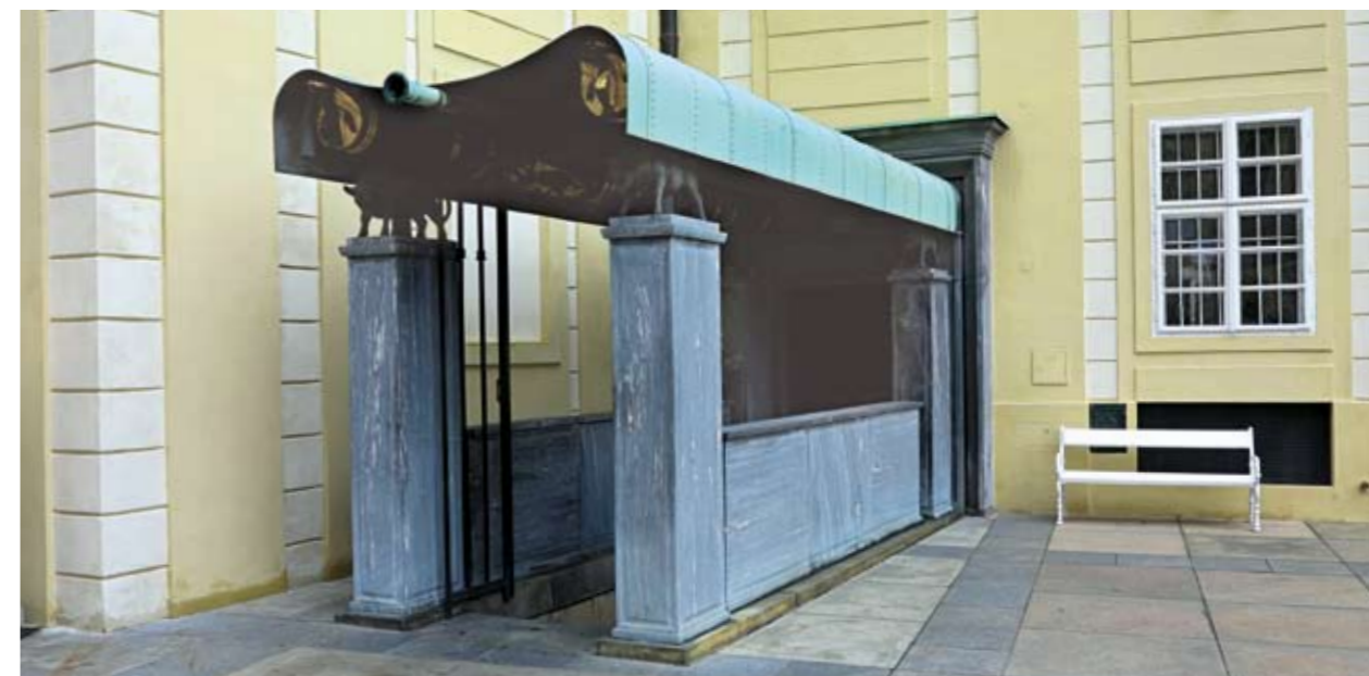
Hold býčímu kultu vzdal architekt slovinského původu Jože (Jozip) Plečnik stavbou Býčího schodiště spojujícího třetí nádvoří Pražského hradu s jeho jižními zahradami.

s drakem je zdoláváním energie země. Jiří draka nezabíjí, nýbrž krotí jeho sílu. Již jeho jméno naznačuje, že je člověkem, který dobře rozumí přírodním silám. Řecký ekvivalent českého jména Jiří je Georgios a znamená zemědělec (ge – země a ergon – práce).