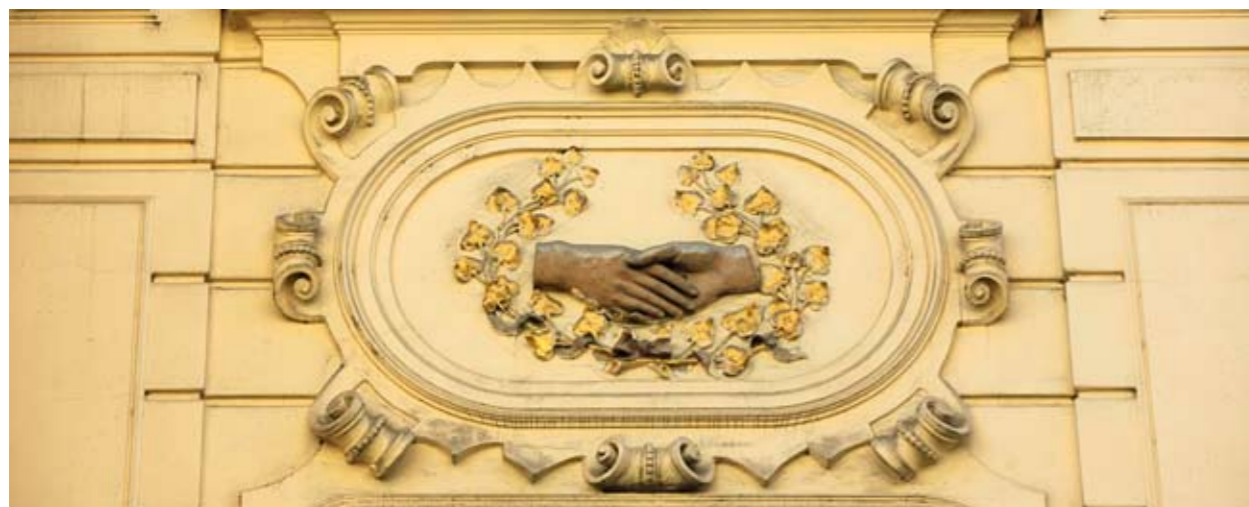
Domovní znamení na domě v ulici Na Zderaze. Mithra byl bohem smlouvy potvrzené stiskem ruky. Rituální stisky rukou jsou dodnes poznávacím znamením svobodných zednářů.

Symbolika Mithry, génia nebeského světla a strážce neporušitelnosti smluv, se objevuje i na pražských dominantách. Na budově České národní banky je umístěna měděná plastika z roku 1898. Krácející Génius (strážce) v rozevlátém šatě drží v pravé ruce pochodeň. Po svém boku má lva stojícího pravou přední tlapou na kouli. Čelenka, plášť i pochodeň jsou, stejně jako u americké zednářské Sochy Svobody z roku 1886, Mithrovy základní atributy. Lev je odkazem na mithraického muže se lví hlavou držícího klíč (ke světu-kouli), označovaného jako Aion či Kronos.