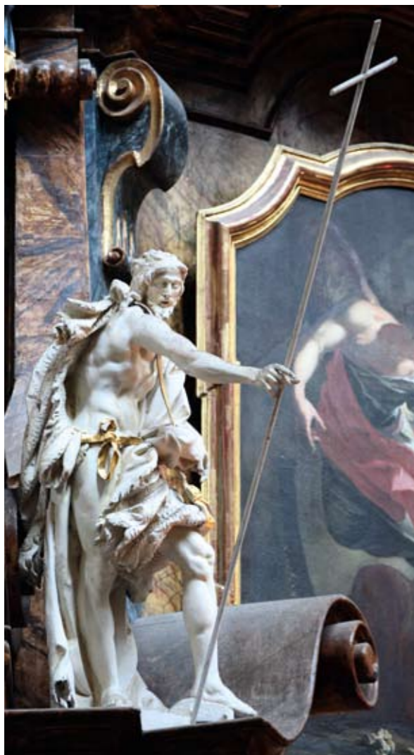
Svatý Jan Křtitel, kostel Panny Marie Sněžné.

Jan Křtitel žil v 1. století příkladným životem na poušti, oděn jen do velbloudího rouna. Živil se medem a kobyilkami. Ve věku třiceti let se stal populárním kazatelem a pokřtil mnoho osob, které naslouchaly jeho vizi budoucího světa. Jedním z pokřtěných byl i Ježíš Kristus. Jan Křtitel