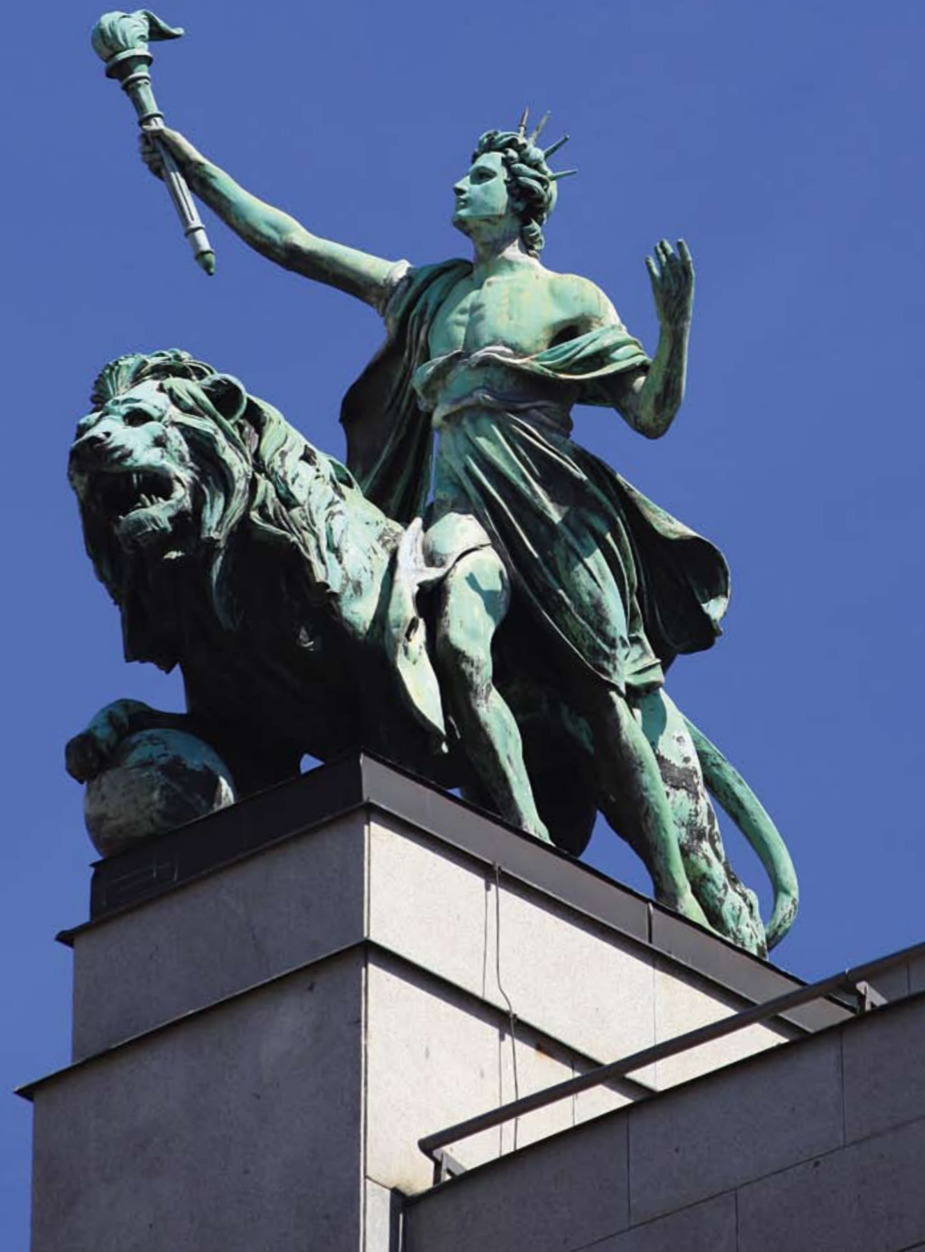
Génius se lvem, plastika z měděného tepaného plechu, Antonín Popp, Česká národní banka.