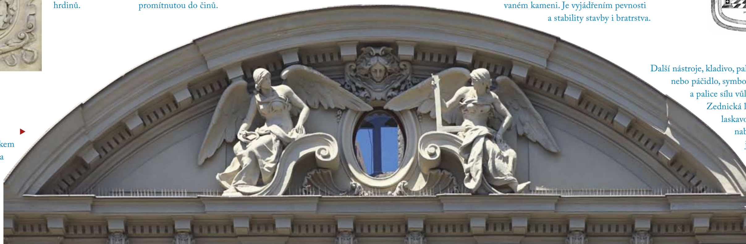
▶ Andělé s kružítkem a úhelníkem na průčelí domu ve Washingtonově ulici.