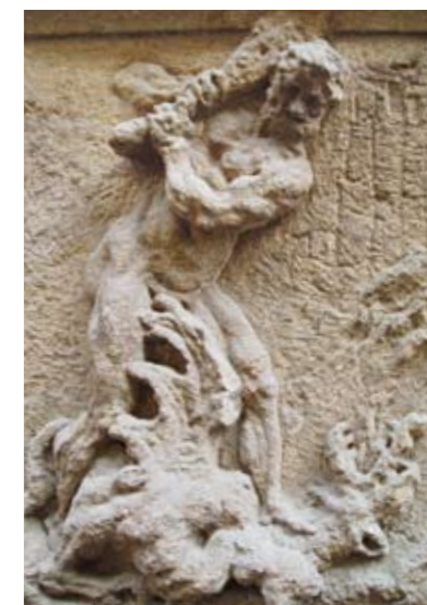
▼ Héraklés zabíjí draka Ládóna, Clam-Gallasův palác.

◀ Bájný egyptský mudrc Hermés Trismegistos neboli Hermés Tříkrát veliký, latinsky Mercurius ter Maximus, je považován za původce alchymie, astrologie a magie. Podle něj jsou tato umění nazývána hermetická. Znovuobjevení a studium antických spisů připisovaných Hermovi Trismegistovi zvaných Corpus Hermeticum a Platónových dialogů v 15. století dalo vzniknout hermetické filozofii. Vůdčí silou renesančního hermetismu byli zakladatel novoplatónské školy ve Florencii Marsiglio Ficino (1433–1499) a jeho žák, kabalista Pico della Mirandola (1463–1494). Nejslavnějším z hermetických textů je takzvaná Smaragdová deska (Tabula smaragdina) popisující v poetických jinotajích Velké dílo (Opus magnum), výrobu Kamene mudrců, který je symbolickou paralelou vnitřní proměny.