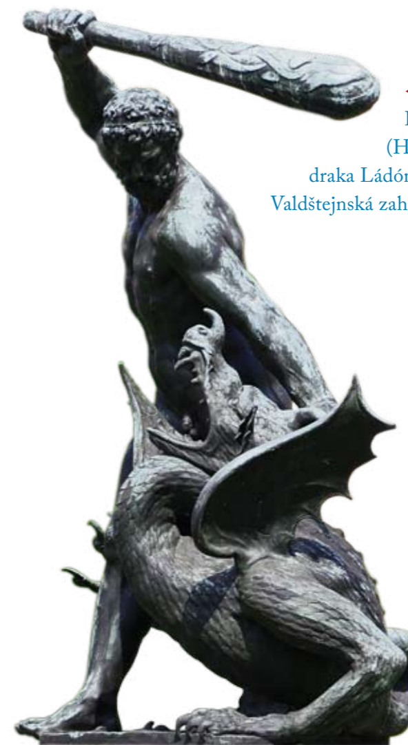
◀ Héraklés (Herkules) zabíjí draka Ládóna, Adrian de Vries, Valdštejnská zahrada.