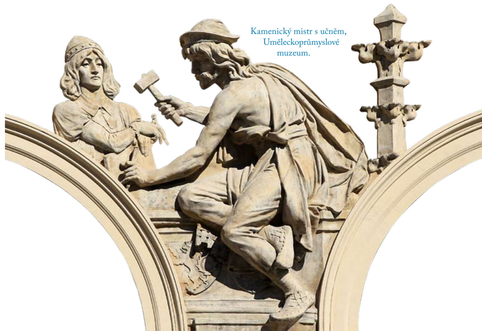
Kamenický mistr s učněm, Uměleckoprůmyslové muzeum.

zabít Jana Křtitele jako strůjce státního převratu. Možná právě proto z něj svobodní zednáři učinili svého patrona, neboť v něm viděli křesťanského buřiče a revolucionáře. Jeho odvaha postavit se židovskému králi mohla inspirovat zednáře k velkým společenským změnám. Jak ukázaly dvě velké revoluce 18. století i významné reformy za vlády Josefa II., zednáři neváhali použít svůj vliv, prostředky i sílu ke změně společnosti. První revoluce proběhla v letech 1775 až 1776 v severní Americe a vedla ke vzniku Spojených států amerických, jejichž prvním prezidentem se stal svobodný zednář George Washington. Druhá, takzvaná Velká francouzská revoluce, se uskutečnila pod vedením zednářů (generál La Fayette a další) ve Francii v letech 1789 až 1799 a změnila nejstarší středověké evropské království v republiku.