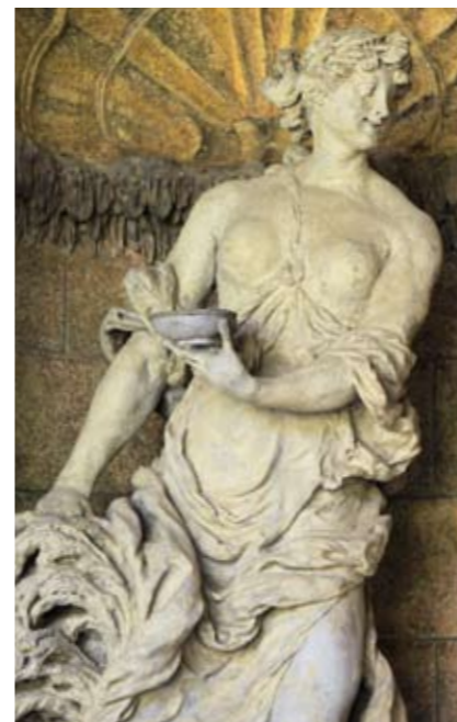
▲ Démétér, Vrtbovská zahrada.

Hermés Trismegistos, Stolcius, Viridarium Chymicum, 1624.